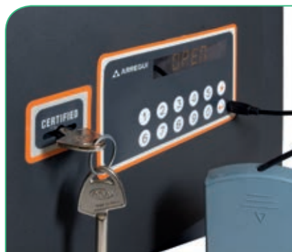
Toma de corriente externa tipo micro USB.