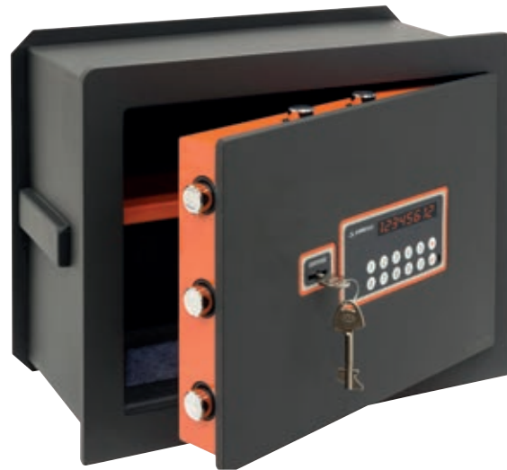
PLUS C Ref. 181050