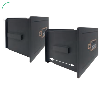
Fondo regulable, 5 posiciones cada 25 mm

* Los mod. 180110 y 180120 no disponen de homologación S2.