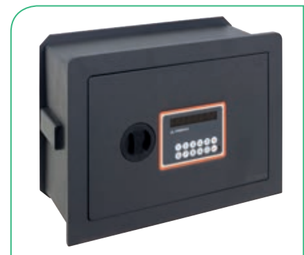
PLUS C ELECTRÓNICA ref. 181120