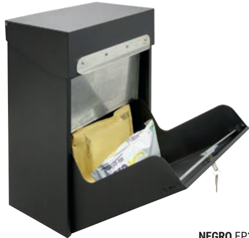
NEGRO EP3004 EAN-8425181738481